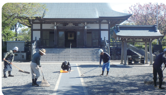
2019年12月 顔娃並びに川辺地区ボランティア活動