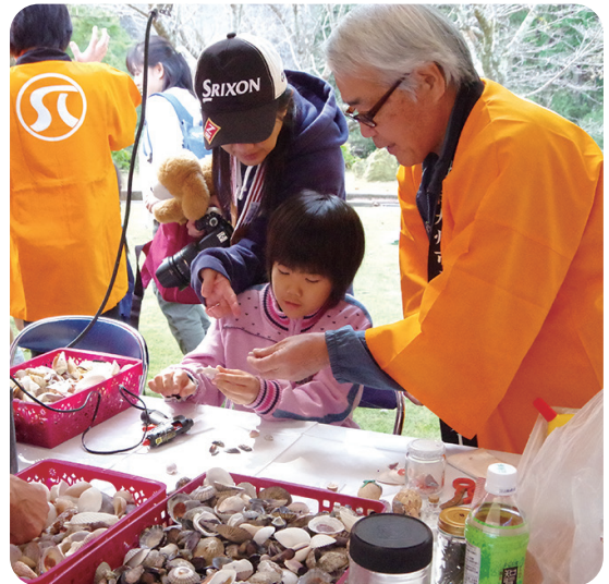
2019年11月 磨崖仏まつり体験学習 (貝殻細工)