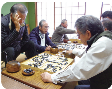
2019年9月 グラウンドゴルフ大会