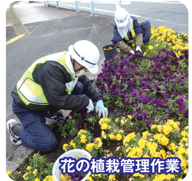
花の植栽管理作業