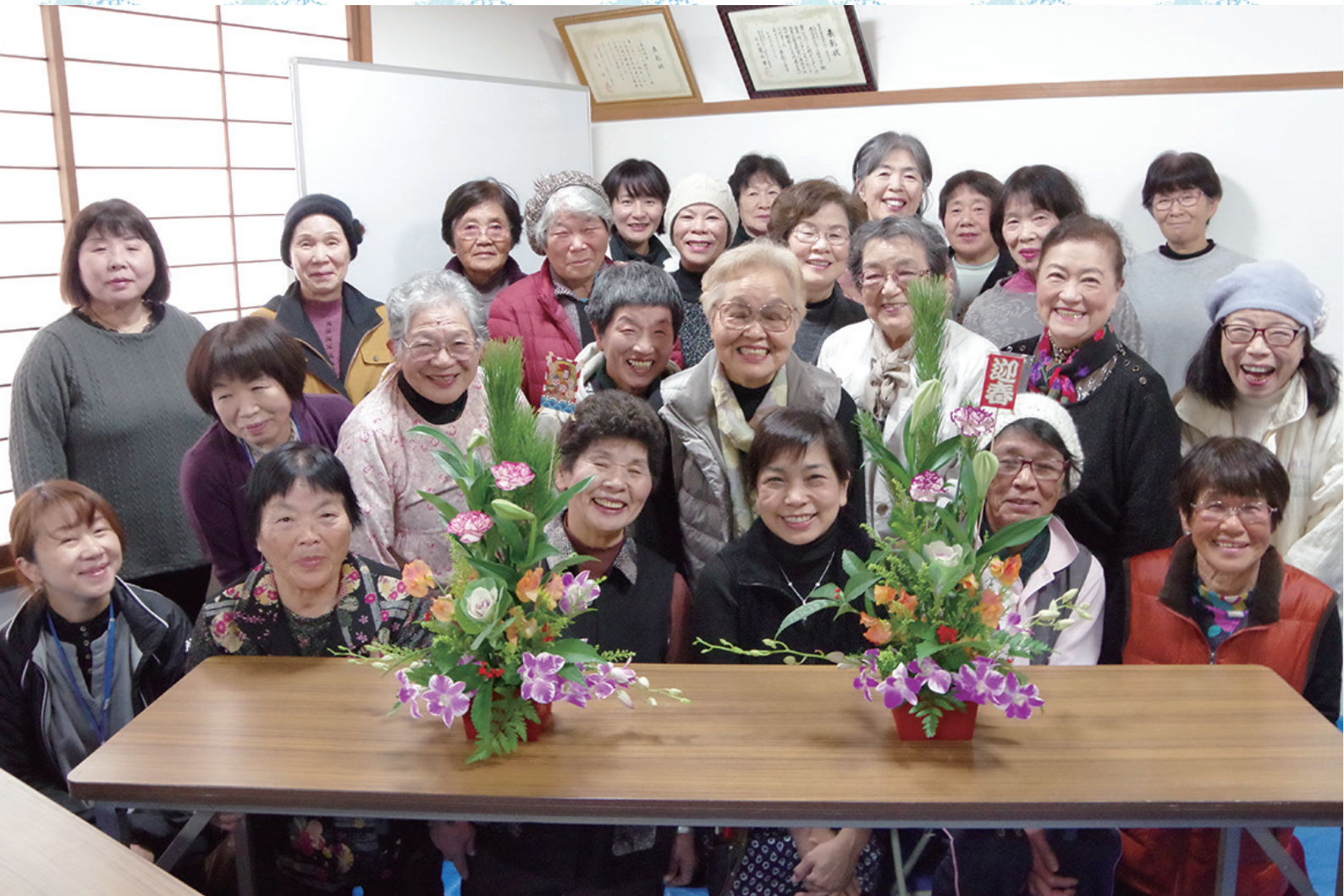
フラワーアレンジメント教室 (2019年12月撮影)