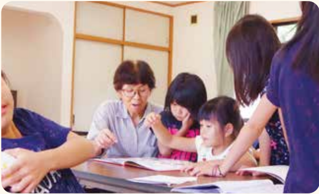
子ども(児童)見守り活動