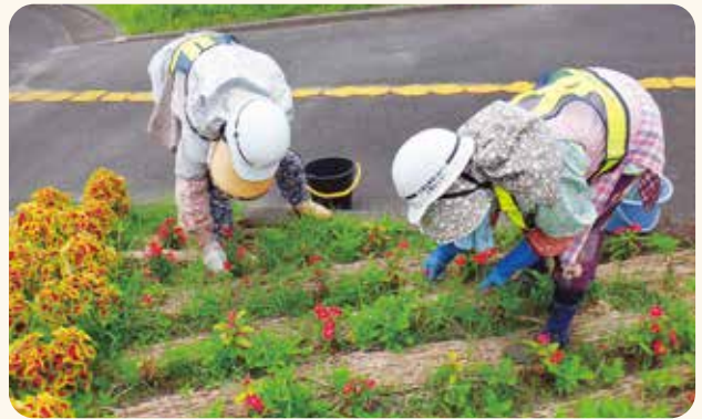
花の植栽管理作業