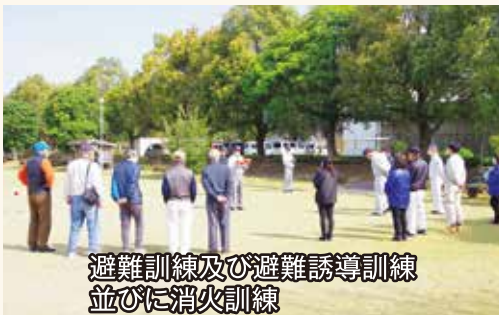
避難訓練及び避難誘導訓練 並びに消火訓練