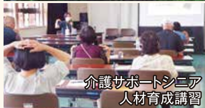
介護サポートシニア 人材育成講習