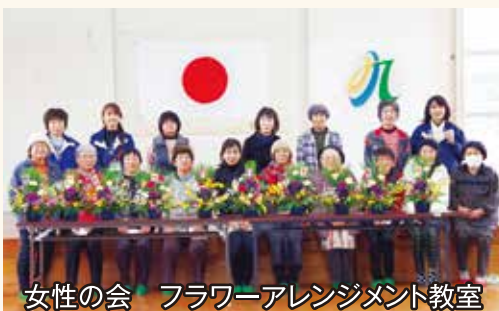
女性の会 フラワーアレンジメント教室