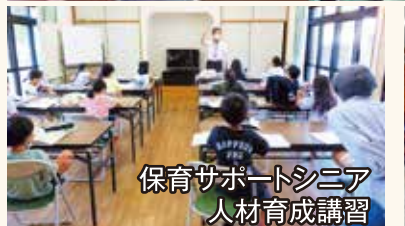
保育サポートシニア 人材育成講習